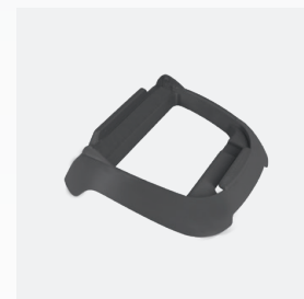
Base para unidad de control