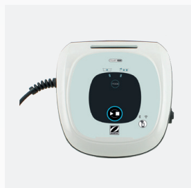
Unidad de control