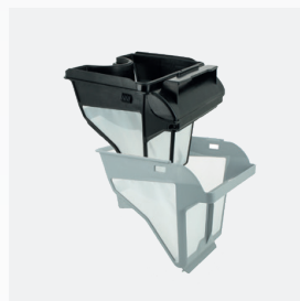
Filtro rectangular Filtro de doble nivel: 150/60 µ